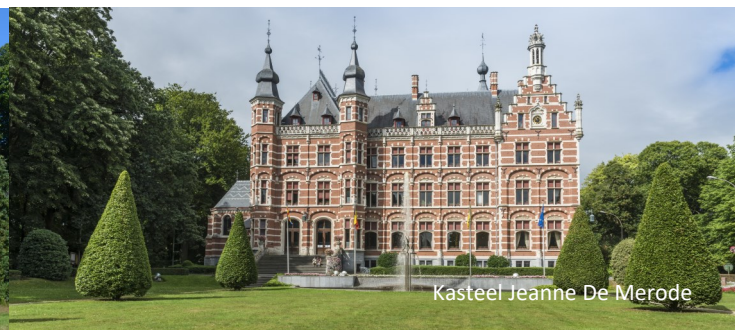
Kasteel Jeanne De Merode