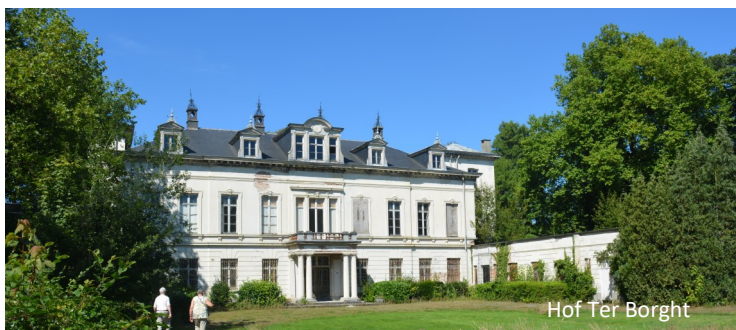
Hof Ter Borcht