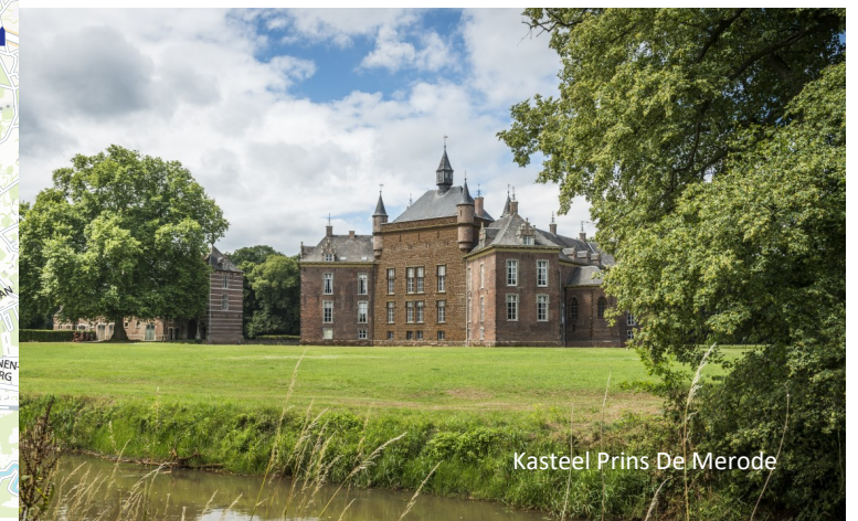
Kasteel Prins De Merode

In Booischoot fietsen we door het 30 ha grote domein van Hof Ter Laken. De geschiedenis gaat terug tot de