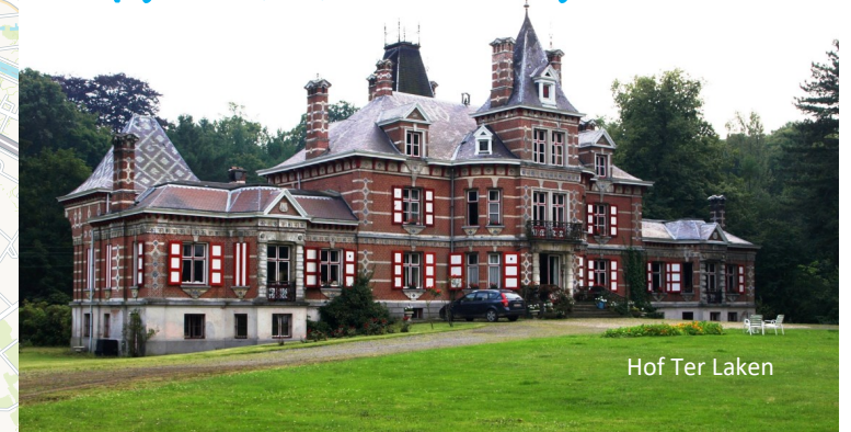
Hof Ter Laken

Deze route leidt je door de Netevallei langs enkele mooie kastelen. Vertrekken doen we aan het Hof van Riemen, net buiten het centrum van Heist-op-den-Berg.